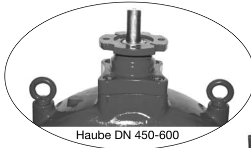
Haube DN 450-600